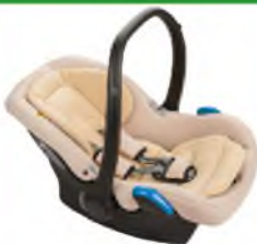
Автокресло группы 0+ для детей массой менее 13 кг