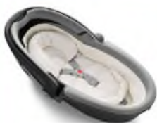
Автокресло «люлька» группы 0 для детей массой менее 10 кг

Детские удерживающие устройства подразделяют на 5 весовых групп: