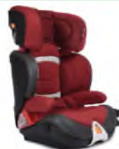
Автокресло группы III для детей массой 22-36 кг (возможно использование бустера)

«Направляющая ляжка» («треугольник», «адаптер», «фиксатор»)