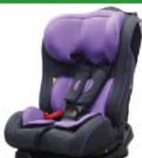
Автокресло группы II для детей массой 15-25 кг