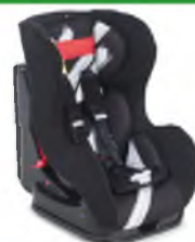
Автокресло группы I для детей массой 9-18 кг